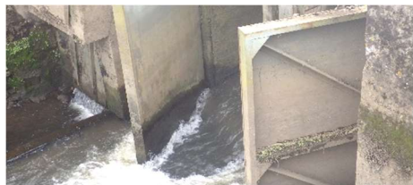
Porte à flots

Les portes à flots et les clapets, plus modestes, interdisent la remontée des eaux du fleuve à l'intérieur des terres en se fermant naturellement. C'est la force de la pression de l'eau qui les fait fonctionner dans un sens ou dans l'autre. Les pelles, elles, s'ouvrent ou se ferment selon les saisons, les événements climatiques ou bien les besoins d'arrosage et sont manœuvrées par l'homme.